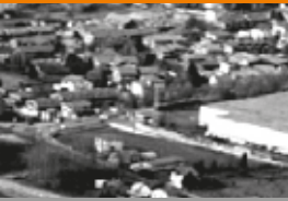
Fonti di pressione