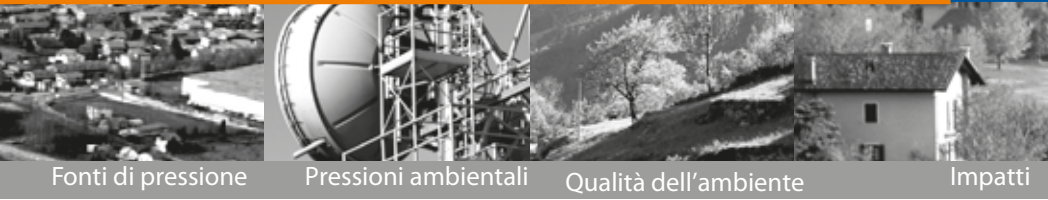
Fonti di pressione