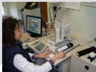
Campioni analizzati da Arpa Piemonte