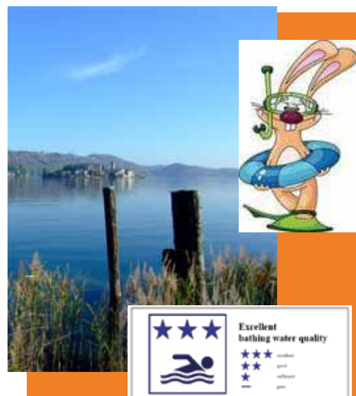
Simbologia UE classi di qualità

Se il risultato è conforme, viene revocata l'Ordinanza con riammissione alla balneazione.