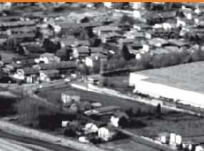
Fonti di pressione