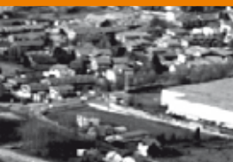
Fonti di pressione