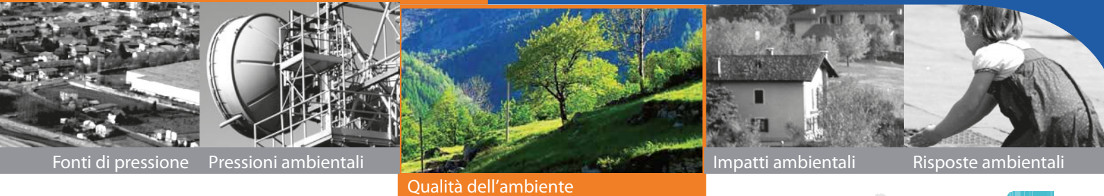
Fonti di pressione Pressioni ambientali