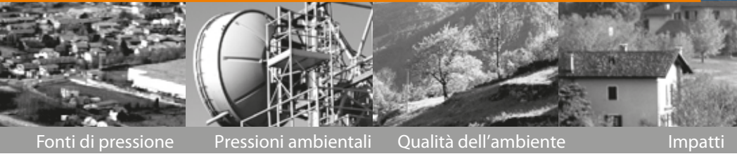
Fonti di pressione Pressioni ambientali Qualità dell'ambiente Impatti