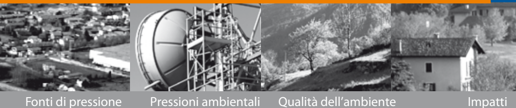
Fonti di pressione