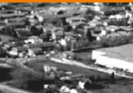
Fonti di pressione