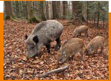
Distribuzione degli incidenti con fauna selvatica

Il Piemonte ospita popolazioni di fauna selvatica di grossa taglia tra le più numerose d'Europa, con un incremento notevole negli ultimi anni, nonostante il territorio regionale sia ampiamente occupato da infrastrutture e insediamenti umani. Molti animali transitano sulle strade di fondovalle nelle zone alpine e prealpine, ma sempre più spesso anche nelle aree collinari e di pianura, con un conseguente aumento degli impatti tra i veicoli e gli animali. Le specie coinvolte con più frequenza sono i Caprioli (48,5% dei casi) i Cinghiali (40,8%), fonte: Regione Piemonte.