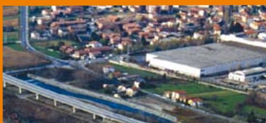
Fonti di pressione