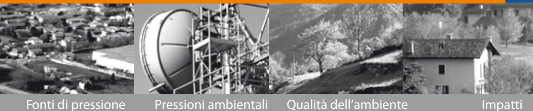
Fonti di pressione