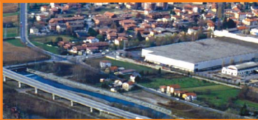
Fonti di pressione