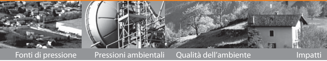
Fonti di pressione