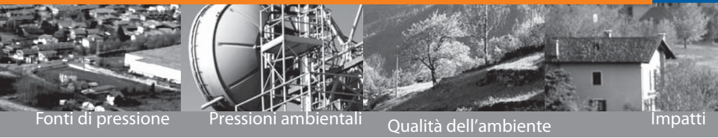
Fonti di pressione