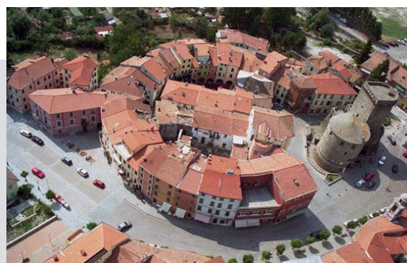
Comune di Varese Ligure

Con l'imminente approvazione del collegato ambientale sulla green economy , il parlamento italiano darà un forte contributo al riconoscimento dell'importanza del sistema EMAS.