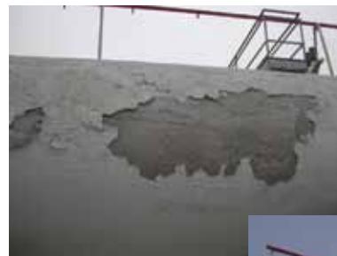
Aspetti tecnici: situazione ante e post ispezione

Tali verifiche sono di competenza della Regione, che in Piemonte ha demandato ad Arpa, e la loro programmazione è stabilita sulla base di diversi criteri, in primis lo stato di implementazione del Sistema, la pericolosità dei processi svolti e gli eventuali eventi incidentali occorsi. In ogni caso la periodicità di controllo non è superiore ai tre anni.