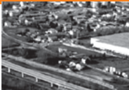
Fonti di pressione