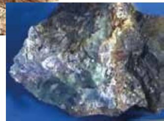
L'Amiantifera di Balangero