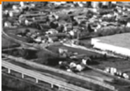
Fonti di pressione