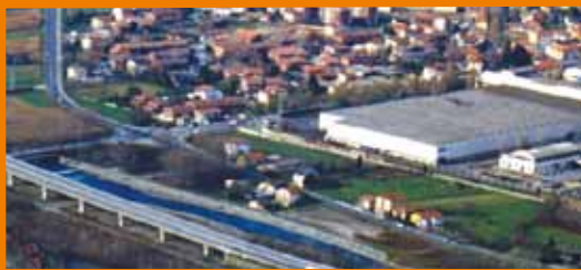
Fonti di pressione