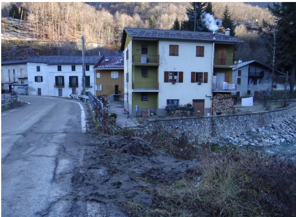
Figura 7. Pamparato, loc. Borgo Riviera. Fotografia scattata il 30 novembre 2016

Nella Valle Casotto le maggiori criticità si sono avute nell'abitato di Pamparato per gli edifici posti a ridosso dell'alveo del torrente, in particolare quelli del Borgo Riviera, investiti dalle acque esondate; critica anche la situazione lungo la strada di fondovalle, danneggiata in svariati tratti a causa dei processi erosivi di sponda.