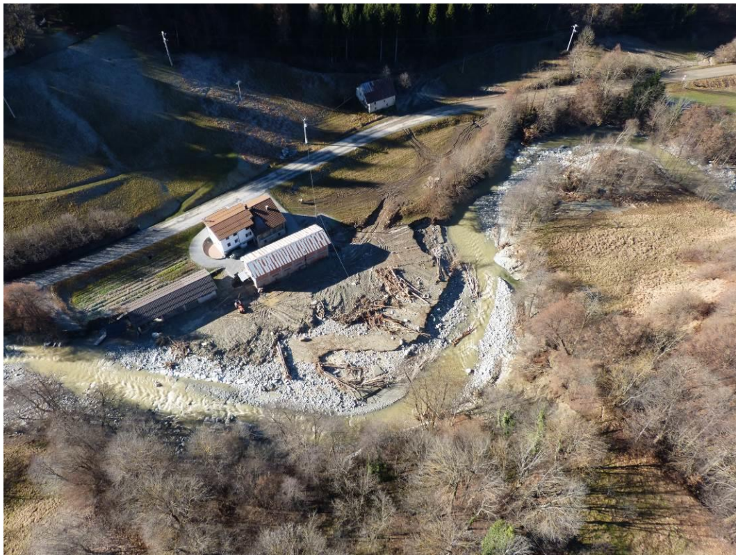
Figura 10. Torre Mondovì, loc. Melu-Merizzo; violenta attività torrentizia con coinvolgimento di una piccola azienda agricola. Fotografia scattata il 30 novembre 2016