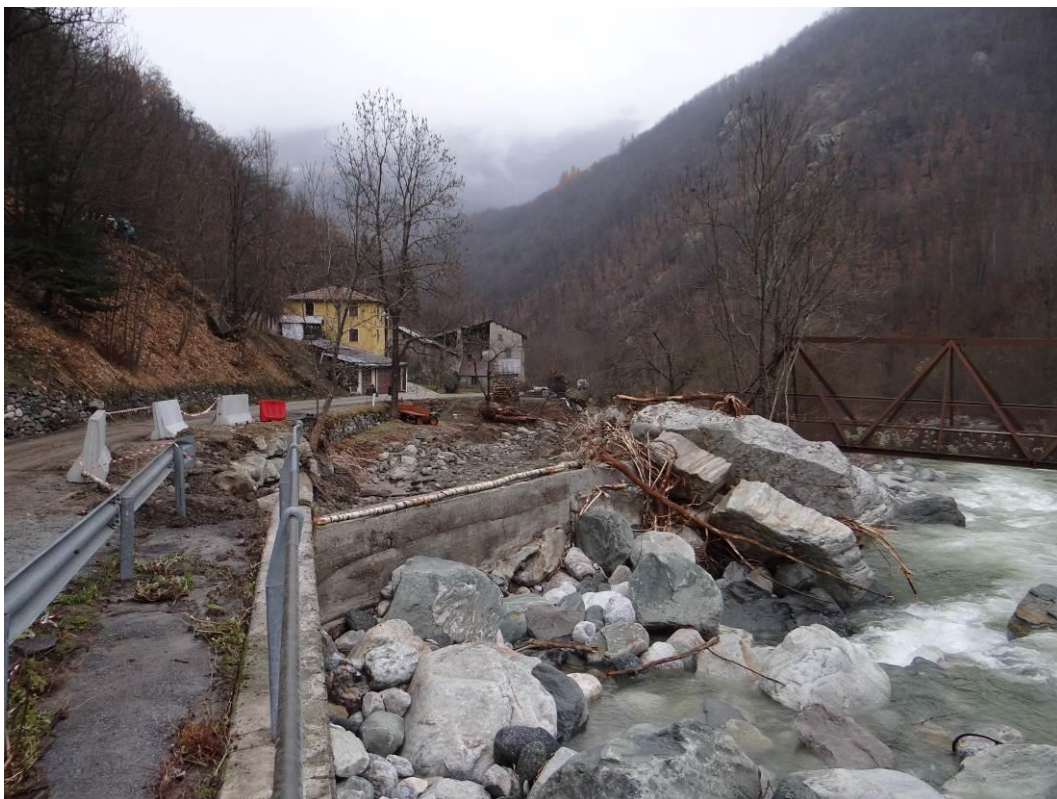
Figura 5. Frabosa Soprana, loc. S. Rocco-Bottera; esondazione in destra idrografica con coinvolgimento della strada e della borgata. Fotografia scattata il 28 novembre 2016