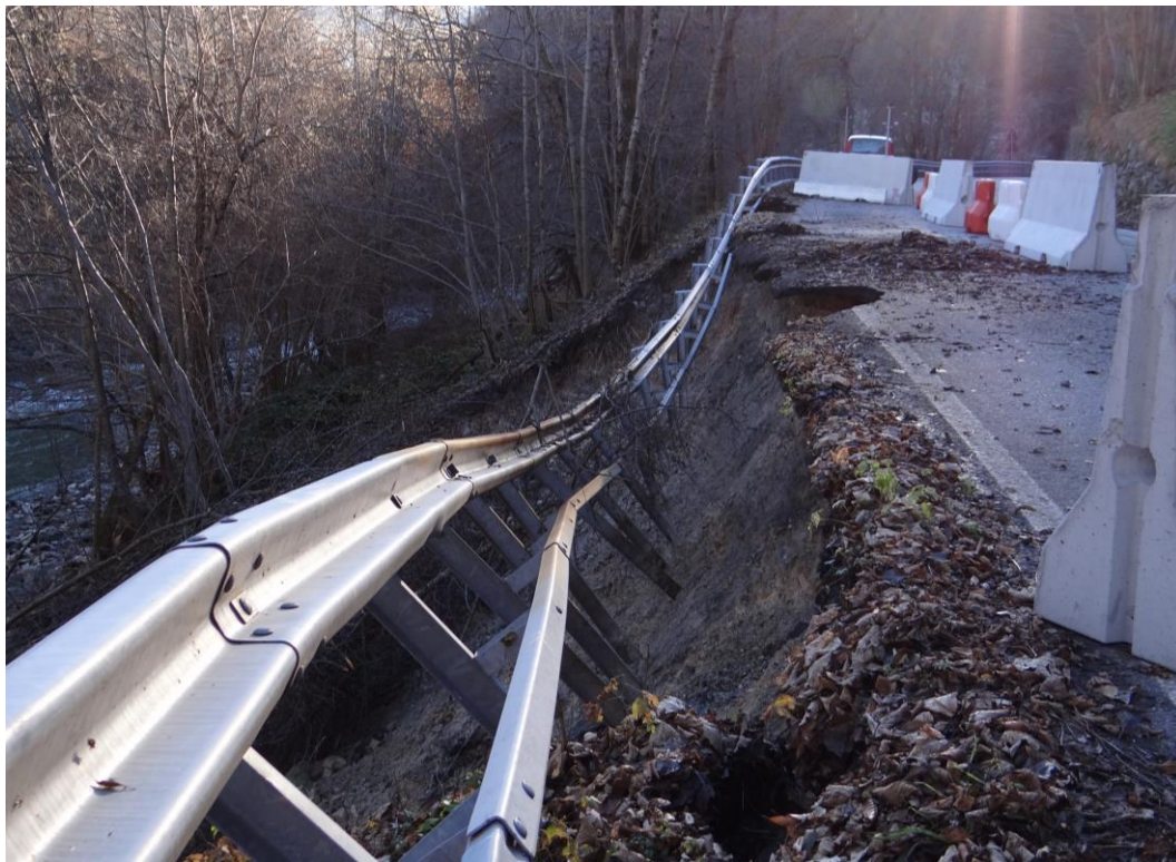
Figura 8. Pamparato, loc. Curto; erosione spondale, danni alla provinciale di fondovalle. Fotografia scattata il 30 novembre 2016