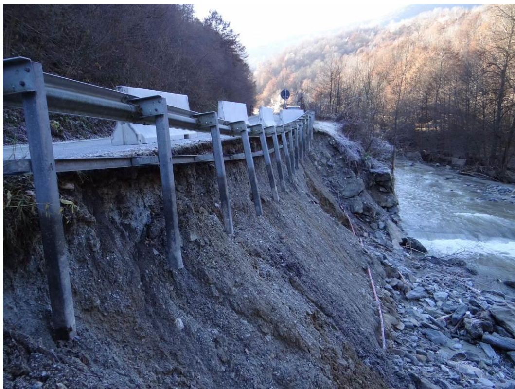
Figura 11. Monasterolo Casotto, loc. Costacalda; erosione spondale, danni alla provinciale di fondovalle. Fotografia scattata il 30 novembre 2016