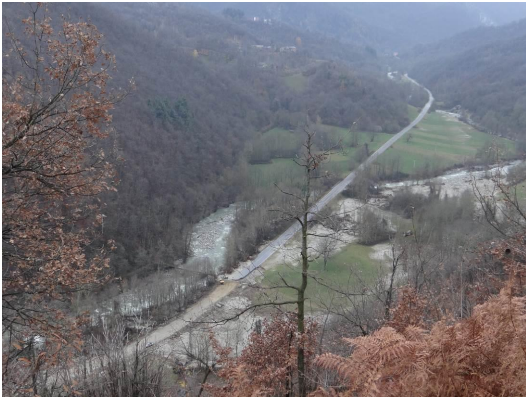
Figura 4. Effetti della piena del 24-26 novembre 2016 in corrispondenza del Ponte dei Gorrazzi