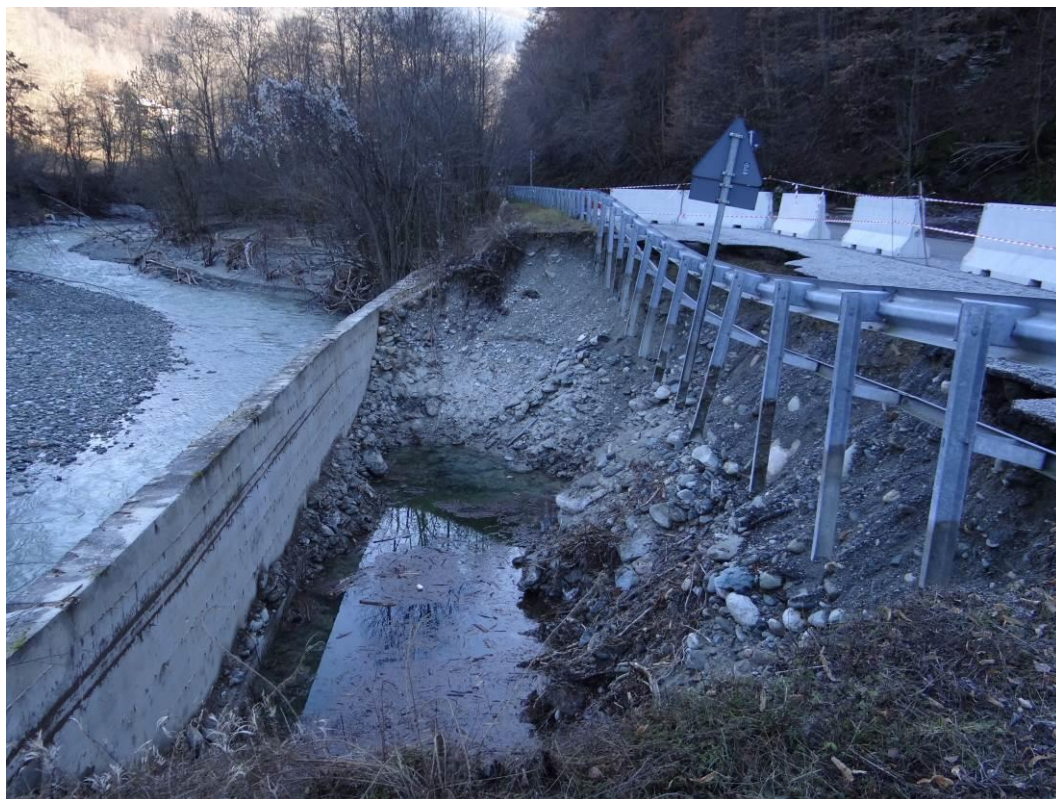
Figura 9. Torre Mondovì, loc. Donato; erosione spondale a seguito di sottoscalzamento dell'opera di difesa, danni alla provinciale di fondovalle. Fotografia scattata il 30 novembre 2016