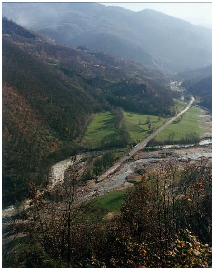
Figura 3. Effetti della piena del 4-6 novembre 1994 in corrispondenza del ponte dei Gorrazzi