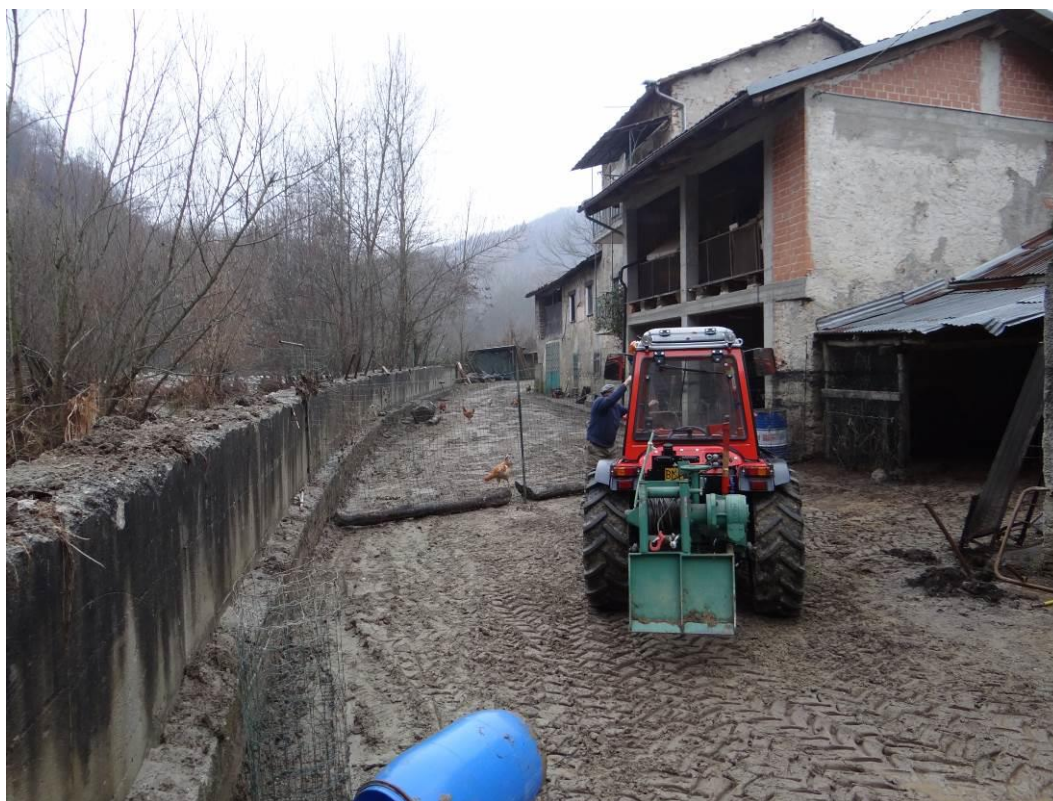
Figura 1. Vicoforte, loc. Martinetto. Fotografia scattata il 28 novembre 2016

Nella Valle Corsaglia le situazioni più rilevanti sono quelle che hanno coinvolto la borgata Martinetto, alluvionata pesantemente come già nel 1994; la strada della fondovalle Corsaglia, asportata per un tratto di circa 40 metri in corrispondenza del Ponte dei Gorrazzi, dove si è riproposta la stessa dinamica verificatasi nel 1994; la località S. Rocco-Bottera, dove l'esondazione del torrente, favorita dalla presenza di un'opera trasversale, ha prodotto danni alla strada; le condotte dell'acquedotto pubblico nei pressi della località Mottoni, a causa della violenta erosione della sponda sinistra.