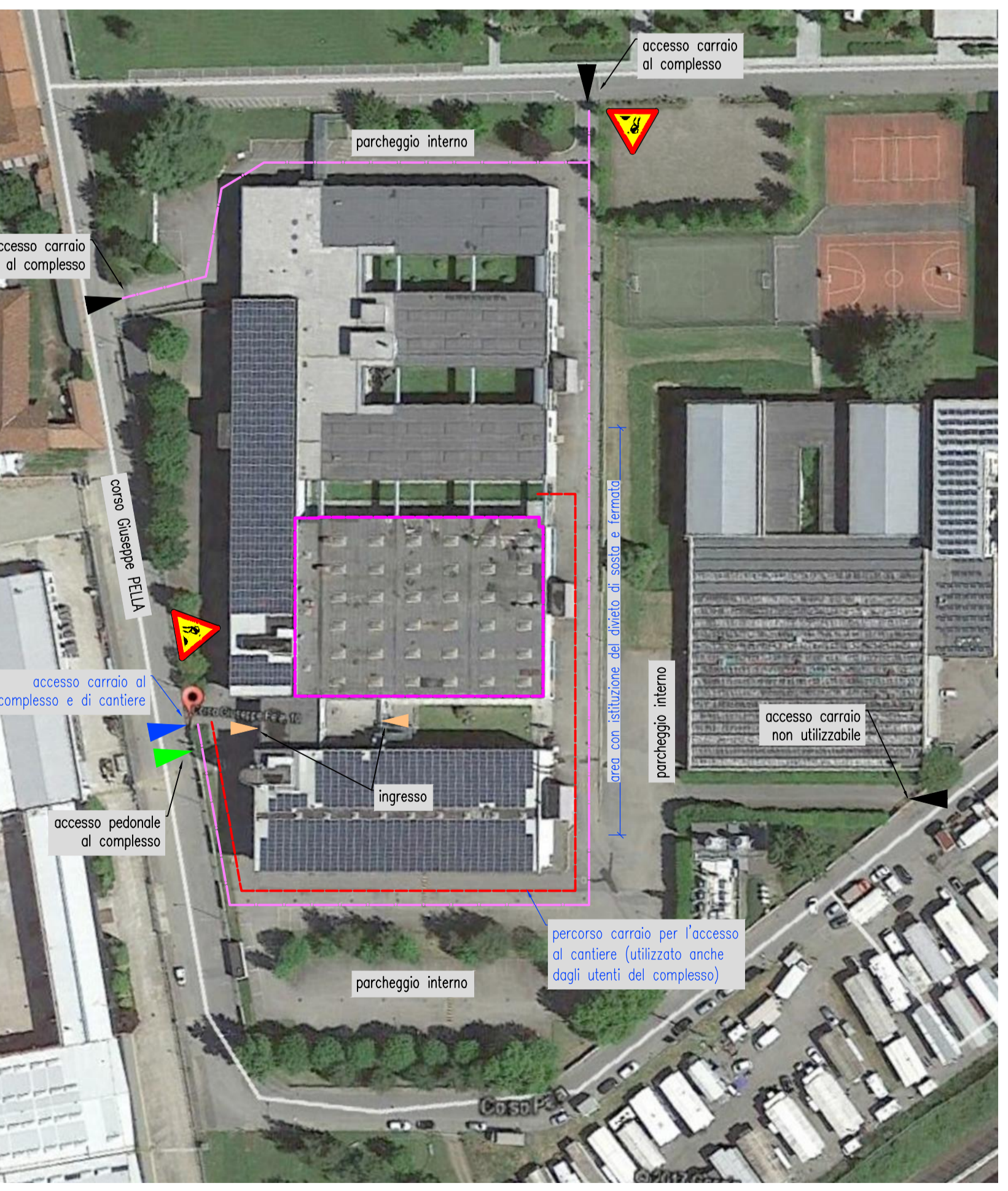
PLANIMETRIA GENERALE scala 1:1000