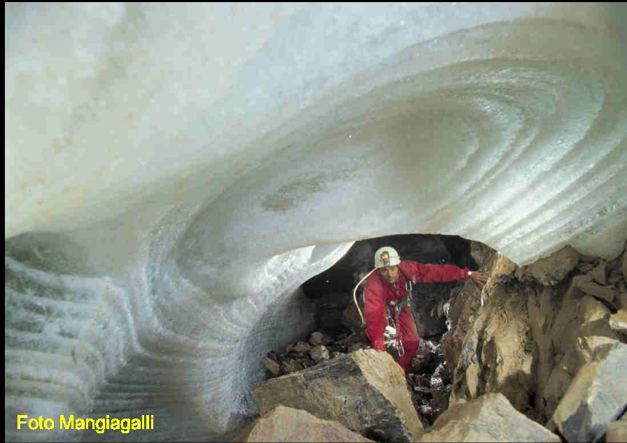
La medesima zona nel 2015 evidenzia come il ghiacciaio si è ridotto di molti metri